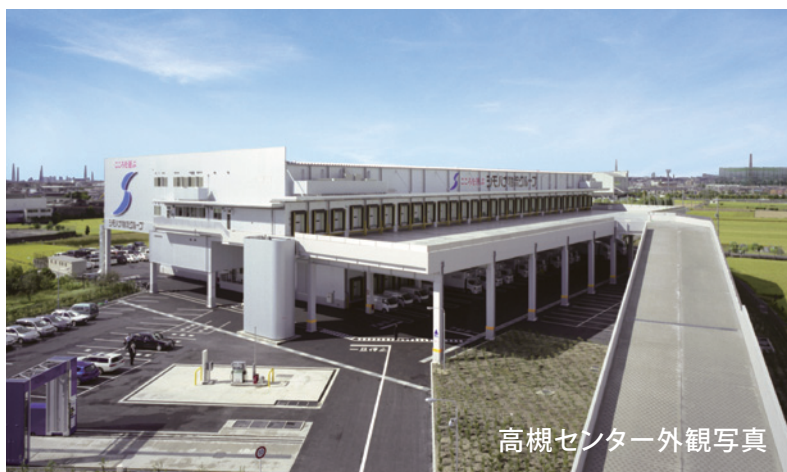
高槻センター外観写真

多様化する一般消費者のニーズを迅速に対応できるシモハナ物流の食品管理品質で、お客様事業の発展に寄与できるよう、今後も関西エリアの更なるネットワーク体制を整備してまいります。