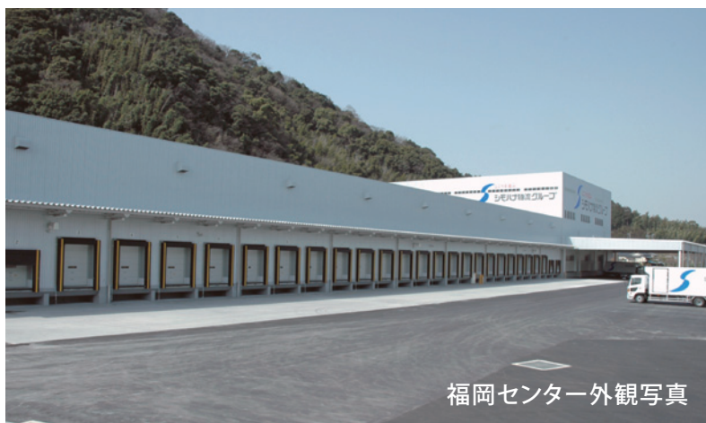
福岡センター外観写真