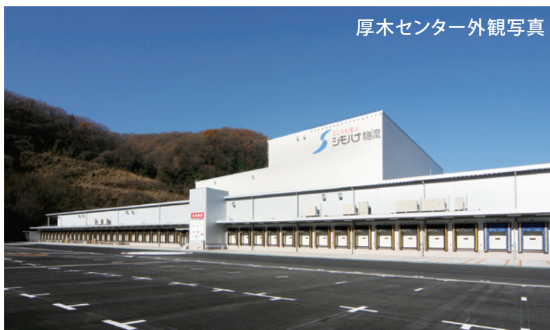
厚木センター外観写真