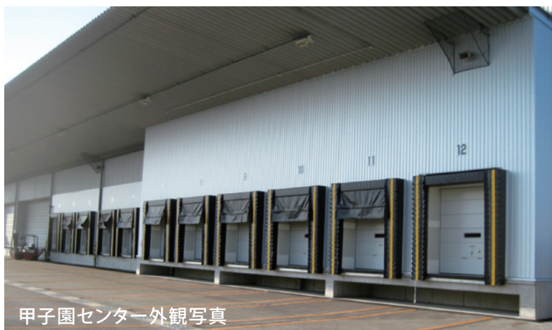
甲子園センター外観写真