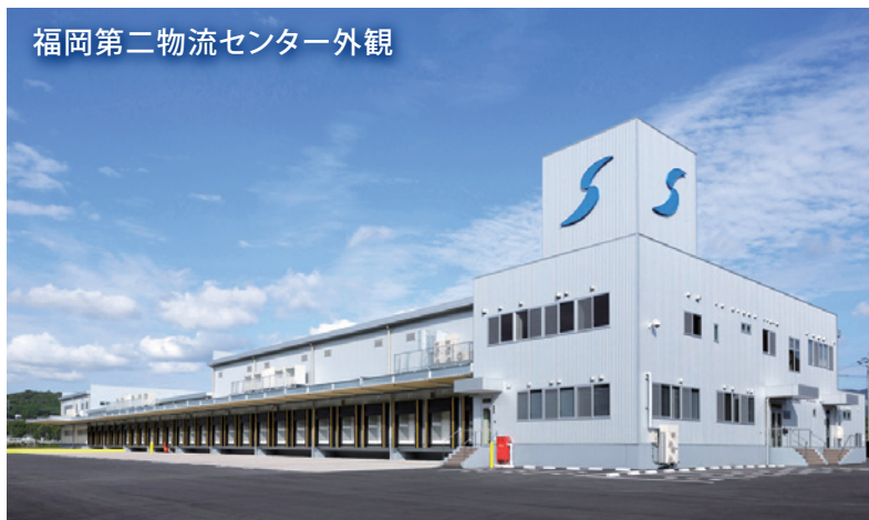
福岡第二物流センター外観