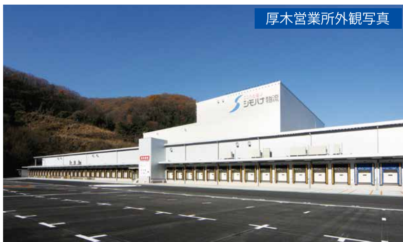
厚木営業所外観写真