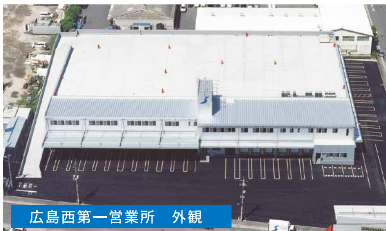
広島西第一営業所 外観

多様化する一般消費者のニーズをフレキシブルに対応するシモハナ物流の管理品質で、お客様事業の発展に寄与できるよう、今後も更なるネットワーク体制を整備してまいります。