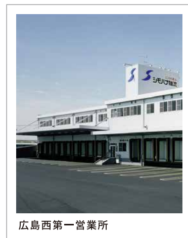
広島西第一営業所