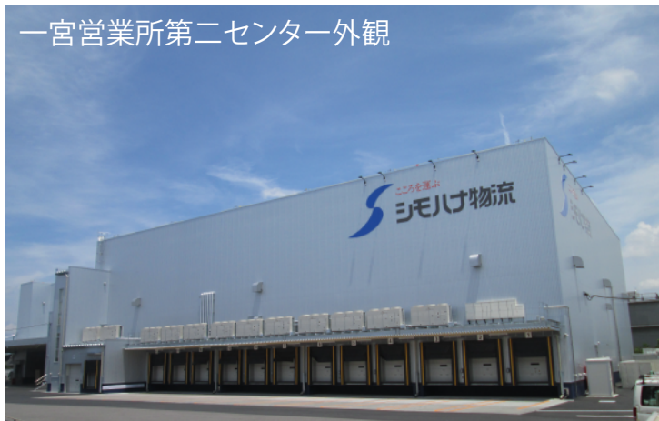
一宮営業所第二センター外観