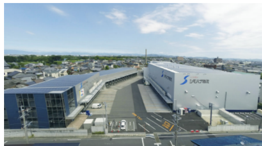
一宮営業所第一センターと第二センター