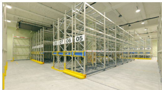
冷凍倉庫(電動移動ラック)