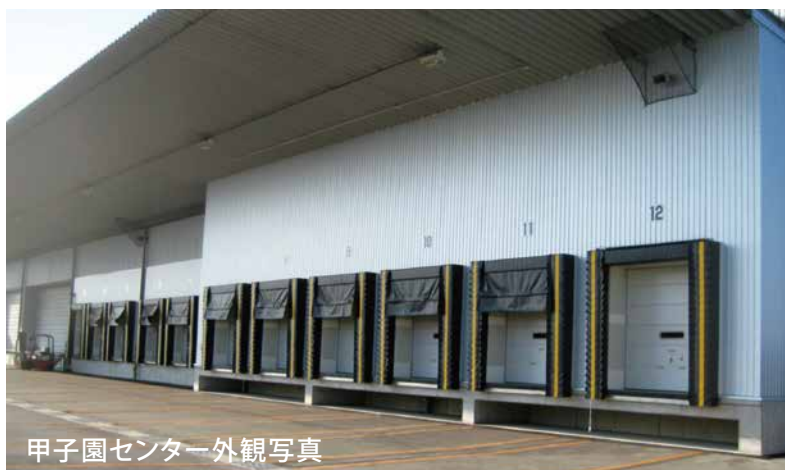
甲子園センター外観写真