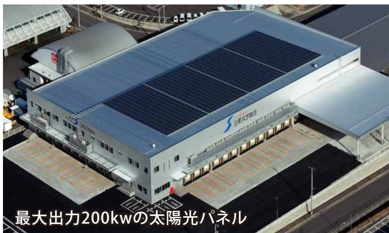
最大出力200kwの太陽光パネル