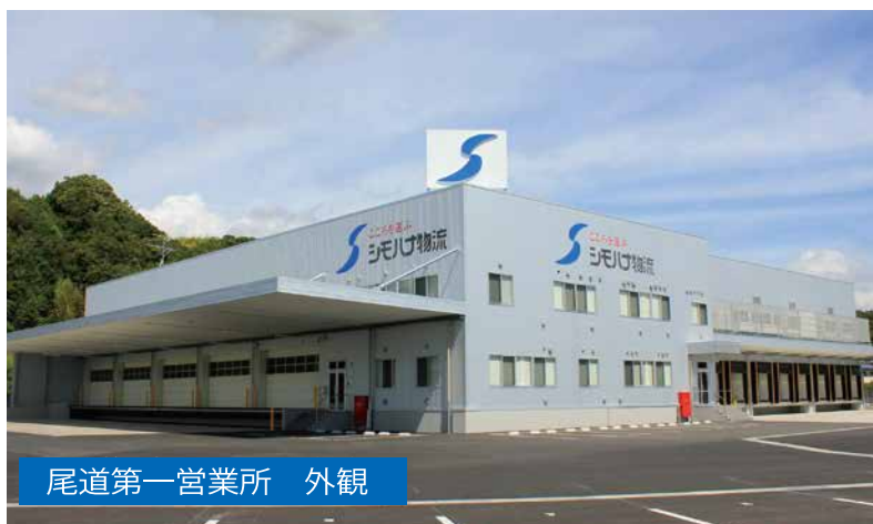
尾道第一営業所 外観