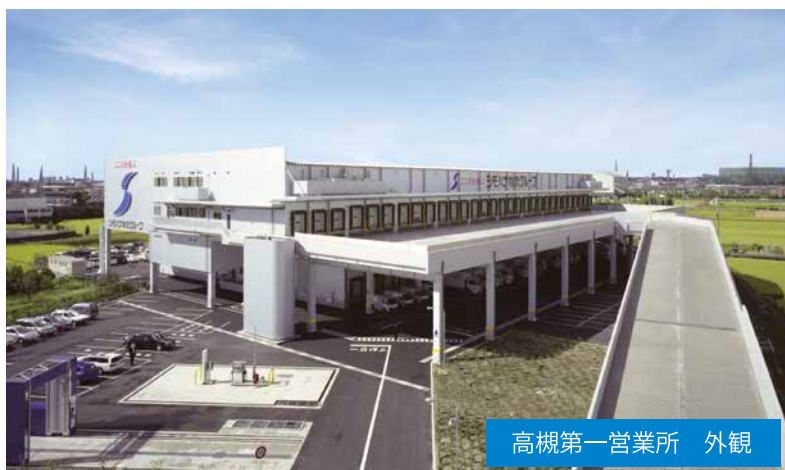
高槻第一営業所 外観

多様化する一般消費者のニーズを迅速に対応できるシモハナ物流の食品管理品質で、お客事業の発展に寄与できるよう、今後も関西エリアの更なるネットワーク体制を整備してまいります。