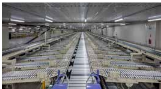
ピースソーター(140間口)

関東エリアに販路・事業拡大を計画するお客様、また関東エリアから全国展開を目指すお客様へ、多彩な物流戦略をご提案できる体制を整え、お客様事業の発展に寄与してまいります。