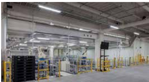
ロボットパレタイザー