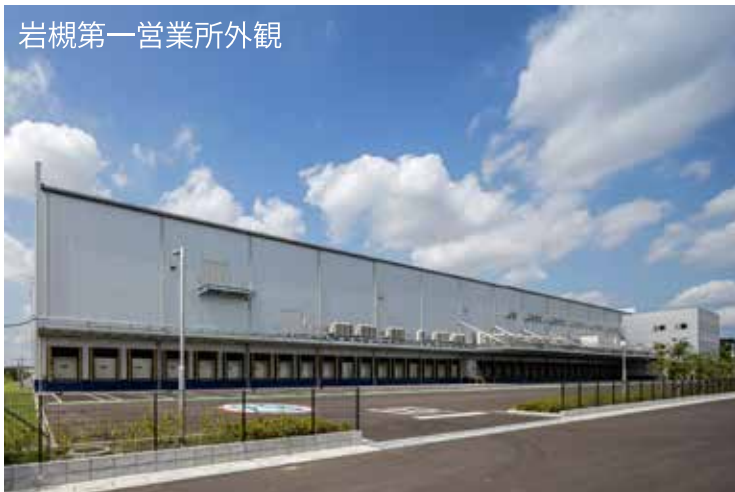
岩槻第一営業所外観