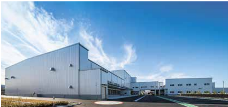
岩槻第二営業所外観

私たちシモハナ物流グループは、今後も最新技術の導入やサービスの向上に注力し、お客様との信頼関係を強化していきます。そして、「岩槻第二営業所」は、食品物流において関東エリアでのリーダーシップを一層強化し、将来的な更なる拡張に向けた基盤を築いてまいります。