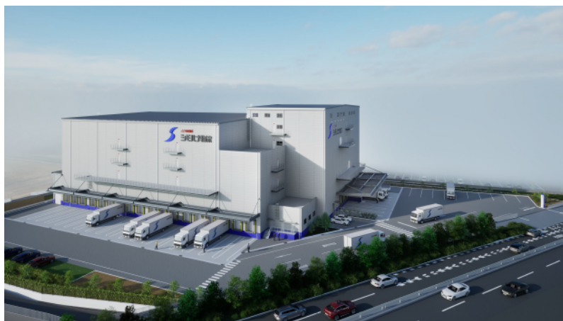
高槻第三営業所完成予想図

好評稼働中の「高槻第一営業所」「高槻第二営業所」及び、「六甲アイランド営業所」「甲子園営業所」との連携により、関西エリアでのより強固な物流体制を構築し、シモハナ物流グループの中核として、お客様事業の発展をお手伝いさせていただきます。